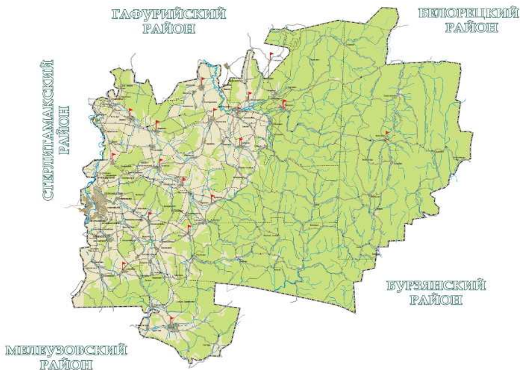
Карта муниципального района Ишимбайский район Республики Башкортостан

научно-познавательный, спортивный, в том числе водный и конный туризм, лечебно-оздоровительный